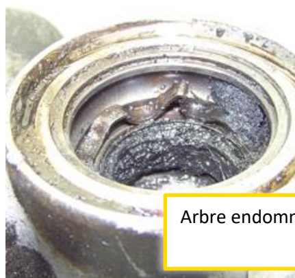
Arbre endommagé ou arraché