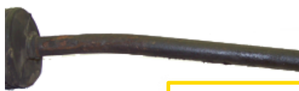
Biellette tordue ou sectionné