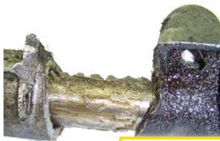
Corps cassé ou fissuré