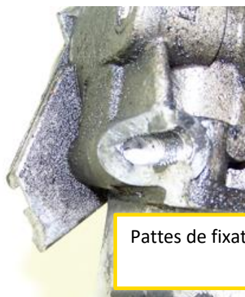
Pattes de fixation cassée