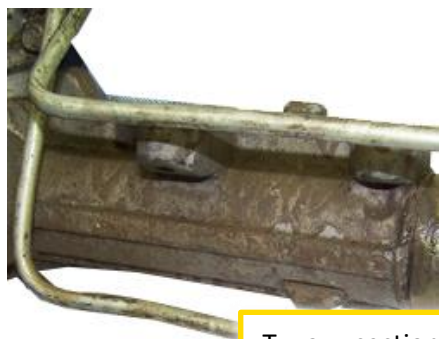
Tuyaux sectionnés, aplatis ou arrachés