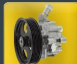
POMPES DE DIR.