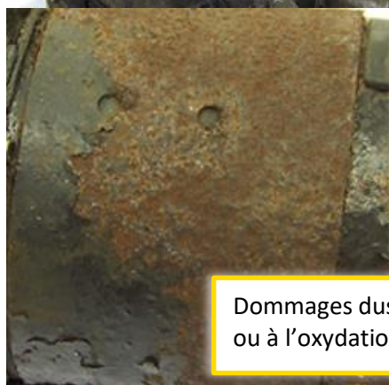
Dommages dus au feu, à la rouille ou à l'oxydation