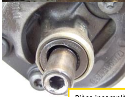
Pièce incomplète (manque poulie, tuyau d'entrée, ...)