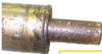
Dommages dus au feu, à la rouille ou à l'oxydation