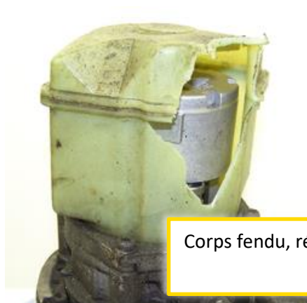
Corps fendu, réservoir cassé