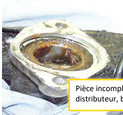
Pièce incomplète (manque tuyaux, distributeur, biellettes, ...)